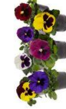
Delta® Pro Blotch Mix