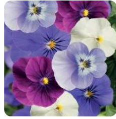
Rocky Plum Mix