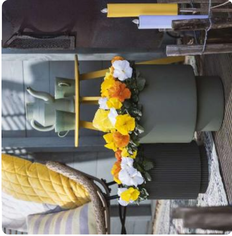
Delta® Pro Citrus Mix