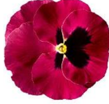
Delta® Pro Rose with Blotch