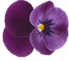
Rocky Wine Red with Face