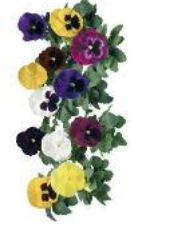
Colossus® All Colors Mix