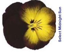
Select Midnight Sun