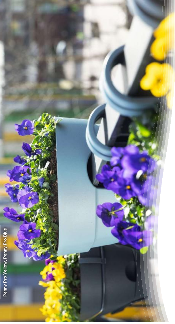
Penny Pro Yellow, Penny Pro Blue