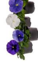
Delta® Pro Cool Waters Mix