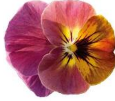
Rocky Pineapple Crush