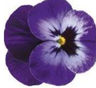
Deltini Violet Blue