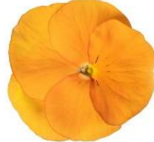
Delta® Pro Clear Orange