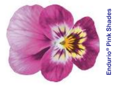
Endurio® Pink Shades