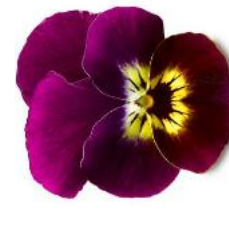
Rocky Violet Tiger Face