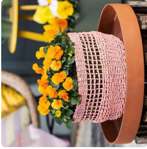
Penny Pro Orange