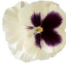
Colossus® White with Blotch