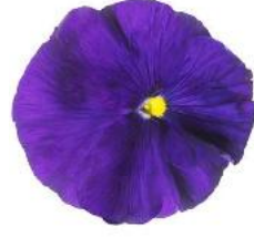
Delta® Deep Blue