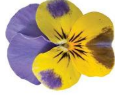
Rocky Yellow Blue Wing