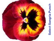
Select Sangria Punch