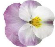
Deltini Rose Pink