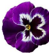
Delta® Pro Violet & White