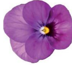
Rocky Plum Antique