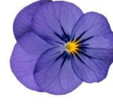
Penny Pro Blue