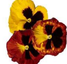
Delta® Pro Fire André Rieu