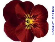
Endurio® Red Flare