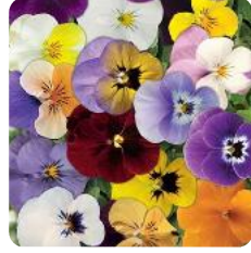
Rocky Complete Mix