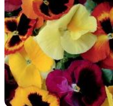
Delta® Apple Cider Mix