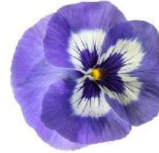
Delta® Pro Marina NEW