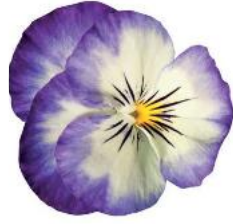
Rocky Purple Picotee