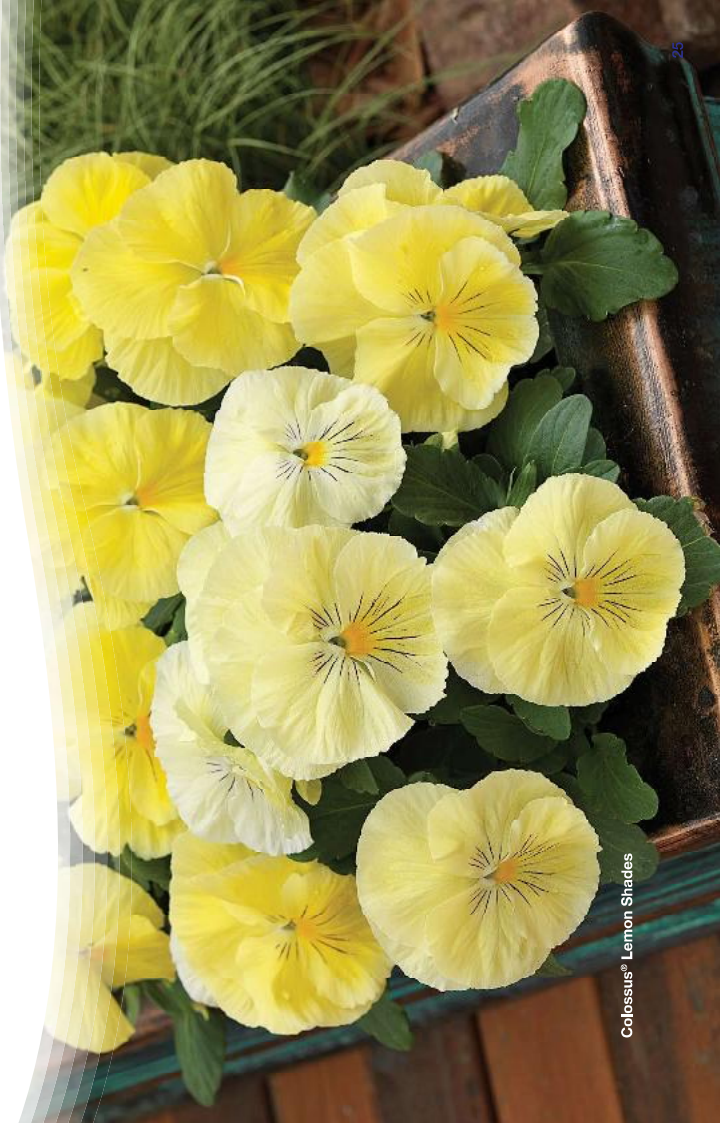
Colossus® Lemon Shades