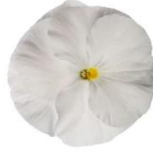
Delta® Pro Clear White