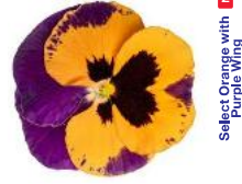
Select Orange with Purple Wing