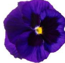
Colossus® Deep Blue with Blotch