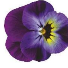
Rocky Violet Blue