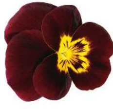
Rocky Red with Yellow Face