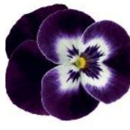
Deltini Violet Face