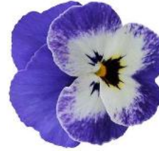
Rocky Delft Blue