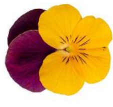
Penny Pro Orange with Purple Wing