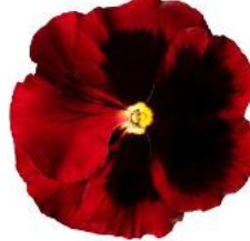
Delta® Pro Red With Blotch