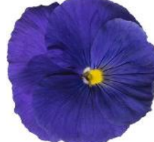
Delta® Pro Clear True Blue