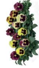
Delta® Rose Surprise