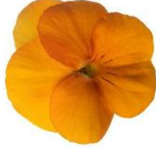
Penny Pro Orange