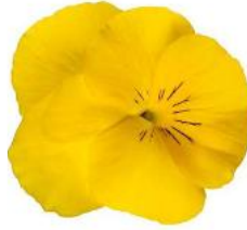
Wellspring Yellow NEW