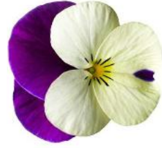
Rocky White with Purple Wing