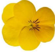
Penny Pro Yellow