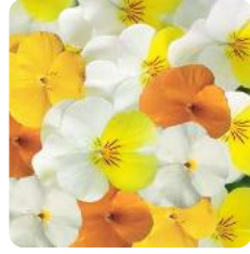
Rocky Lime Mix