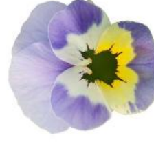
Rocky Marina Sunrise