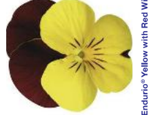
Endurio® Yellow with Red Wing