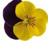
Deltini Yellow Jump Up Early