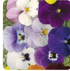
Rocky Uni Mix