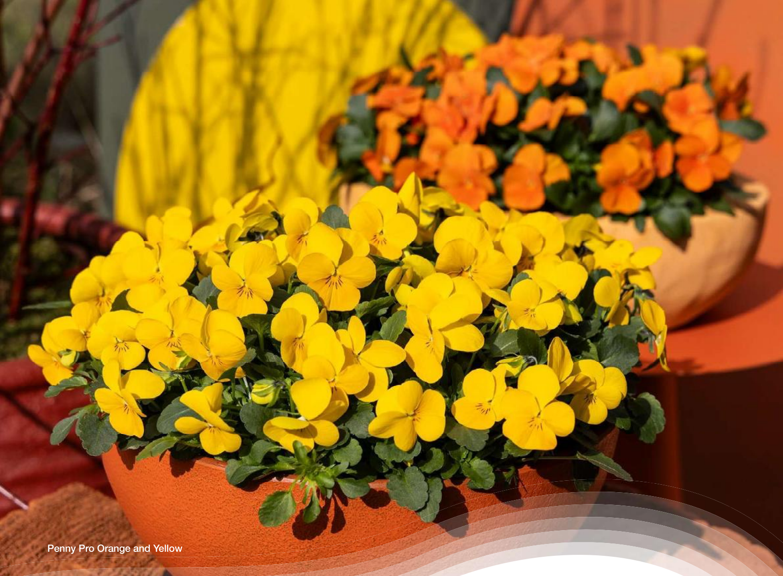
Penny Pro Orange and Yellow