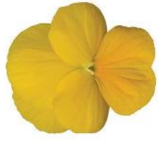
Rocky Golden Yellow