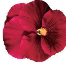
Delta® Pure Rose