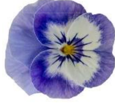
Penny Pro Blue Martina