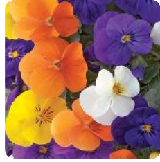
Rocky All Seasons Mix