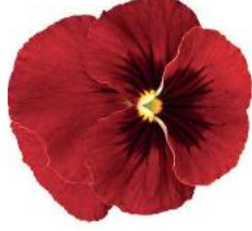
Rocky Red with Blotch