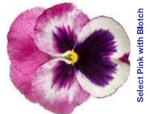
Select Pink with Blotch