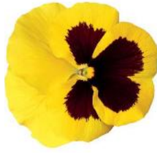
Delta® Yellow with Blotch