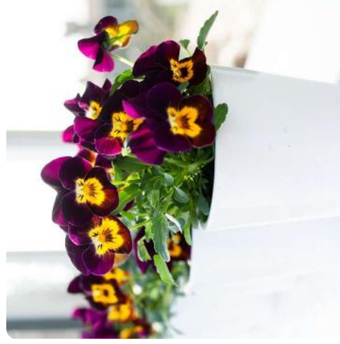
Deltini Purple with Golden Center