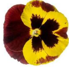
Delta® Pro Yellow with Red Wing