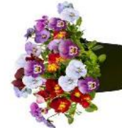
Endurio® Crazy Tropical TrioMix