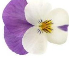
Rocky White with Rose Wing