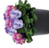
Endurio® Blue Lagoon TrioMix