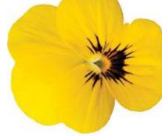
Rocky Yellow With Blotch Early