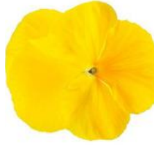
Delta® Pro Clear Lemon