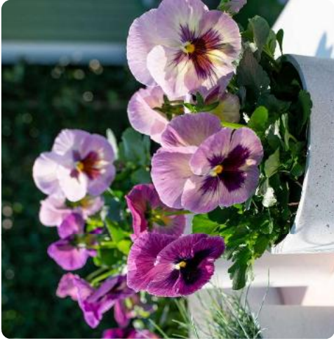
Delta® Purple Surprise