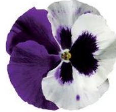
Colossus® White with Purple Wing