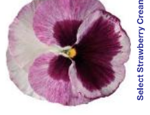
Select Strawberry Cream