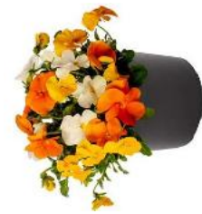
TrioMix Pacific Sunset