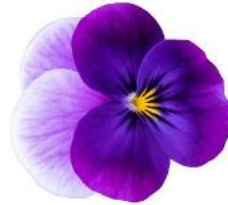
Select Neon Flash NEW