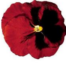
Colossus® Red with Blotch