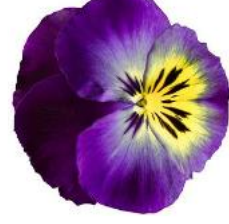
Delta® Blue Morpho