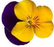
Deltini Yellow Jump Up