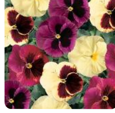
Delta® Monet Mix