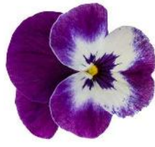
Penny Pro Violet Face