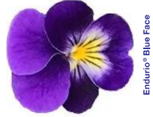
Endurio® Blue Face