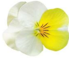
Rocky Sunny Side Up