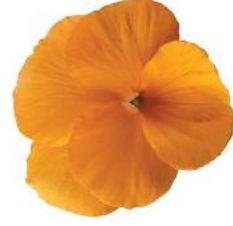
Rocky Tangerine Sell out