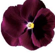
Colossus® Rose with Blotch