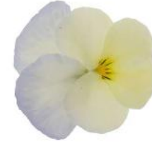
Wellspring Ivory NEW