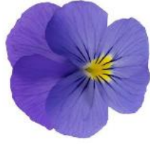
Wellspring Blue NEW