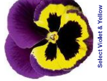
Select Violet & Yellow