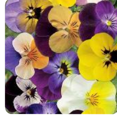
Rocky Special Mix