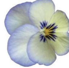
Rocky Blue Picotee