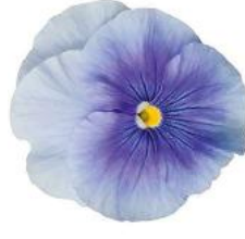
Delta® Pro Clear Light Blue