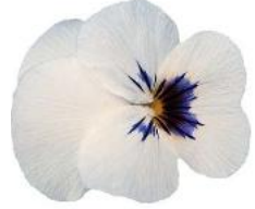
Rocky White with Blotch