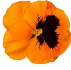
Delta® Orange with Blotch