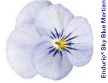
Endurio® Sky Blue Martini