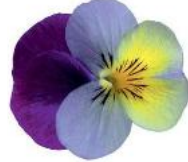
Deltini Blue Purple Wing