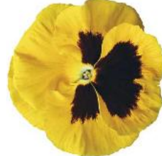
Colossus® Yellow with Blotch