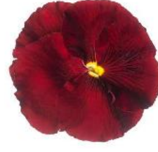
Delta® Pro Clear Red NEW