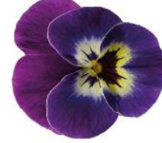
Rocky Purple Face