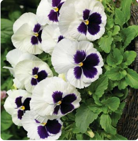
Colossus® White with Blotch