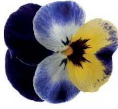
Rocky Jolly Face