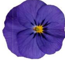
Penny Pro Deep Blue