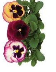
Colossus® Rose Surprise