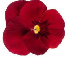
Penny Pro Red