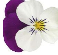
Penny Pro White with Purple Wing NEW