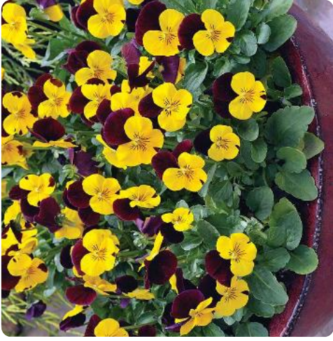
Rocky Yellow with Purple Wing