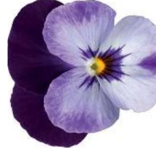
Rocky Denim Jump Up