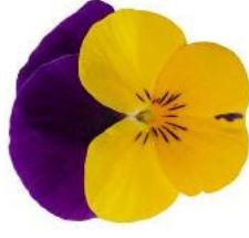
Penny Pro Yellow with Purple Wing