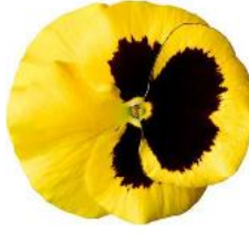
Delta® Pro Yellow with Blotch