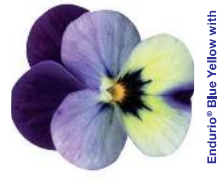
Endurio® Blue Yellow with Purple Wing