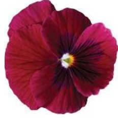
Rocky Rose with Blotch