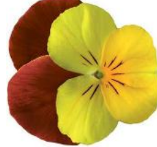
Rocky Yellow with Red Wing