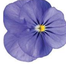
Rocky Blue for You