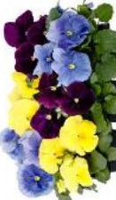
Delta® Pro Tricolor Mix