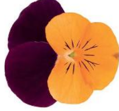
Rocky Orange with Purple Wing