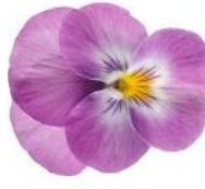
Deltini Lavender Pink Face