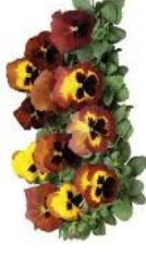
Delta® Fire Surprise