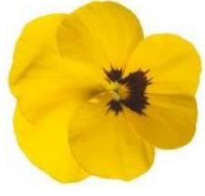
Penny Pro Yellow with Blotch