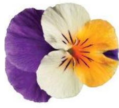
Rocky Peach Jump Up