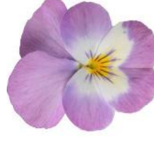
Penny Pro Pink Face