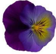
Wellspring Purple Wing NEW