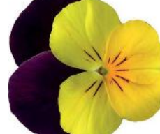
Rocky Yellow with Purple Wing