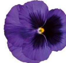
Delta® Pro Deep Blue with Blotch