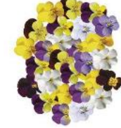
Endurio® Complete Mix