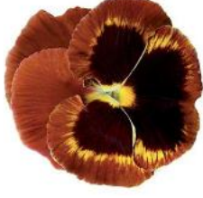
Colossus® Fire Surprise