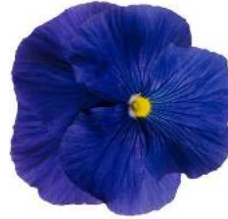
Colossus® True Blue