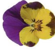
Deltini Yellow and Purple