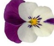
Deltini White Jump Up NEW