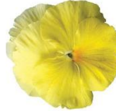
Colossus® Lemon Shades