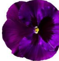
Delta® Pro Neon Violet