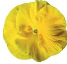
Colossus® Pure Golden Yellow