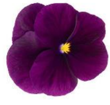
Penny Pro Violet