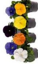
Delta® Pro Clear Colors Mix