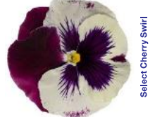
Select Cherry Swirl