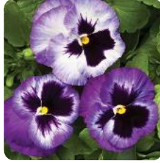
Colossus® Lavender Surprise