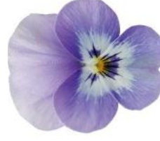
Rocky Light Marina