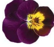
Deltini Purple with Golden Center