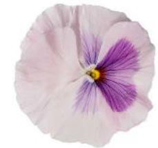
Delta® Pink Shades