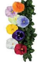
Delta® Sweetlight Mix