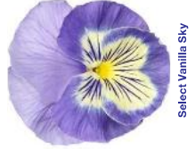
Select Vanilla Sky