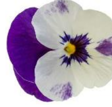
Penny Pro Violet & White