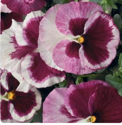
Select Strawberry cream