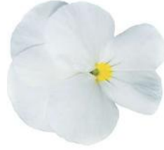
Rocky White Spring