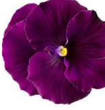
Delta® Pro Clear Violet