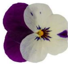
Rocky White Purple Pearls