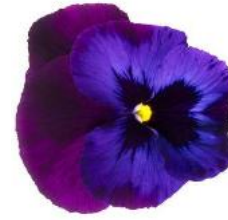
Colossus® Neon Violet