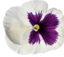
Delta® Pro White with Blotch