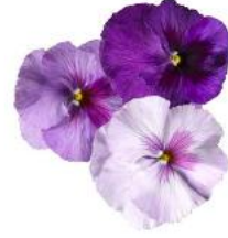
Delta® Pro Lavender Blue Shades