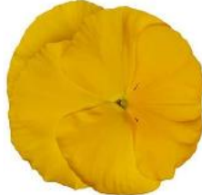
Delta® Pro Clear Yellow