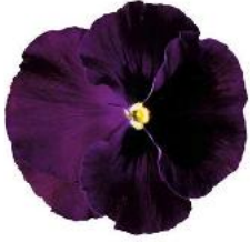
Colossus® Purple with Blotch