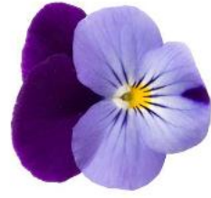
Rocky Lilac with Purple Wing