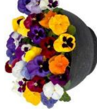
Delta® Pro All Colors Mix