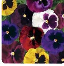
Colossus® Blotched Mix